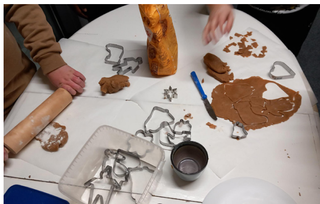
Killgruppen hade secret santa och pepparkaksbakning i vintras.