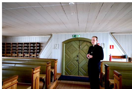
Nämä sivuparvien alapuoliset tilat suunnitellaan erotettavan seinillä niin, että niihin voisi sijoittaa uusia toimintoja, muun muassa WC-tilat.

– Ei täällä mikään ole rikki menemässä, mutta esimerkiksi kun saarnastuolia tarkastelee lähempää. siitä voi huomata lähteneen värikerroksia. Osa keskiaikaisista pyhimyskuvista on myös joutunut jonkinlaisen koin hyökkäyksen kohteeksi.