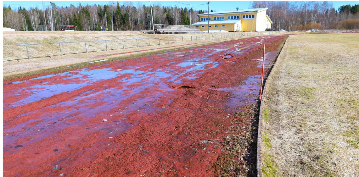
Tältä Strandvallenissa näytti huhtikuun puolivälissä. Urheilukentän korjaustyöt aloitetaan alueen kuivuttua luultavasti toukokuun puolivälissä.

–IF VOM on voinut harjoitella täällä jonkin verran, mutta esimerkiksi hyppylajien harjoittelu ei ole täällä tarpeeksi turvallista. Meille on tie-