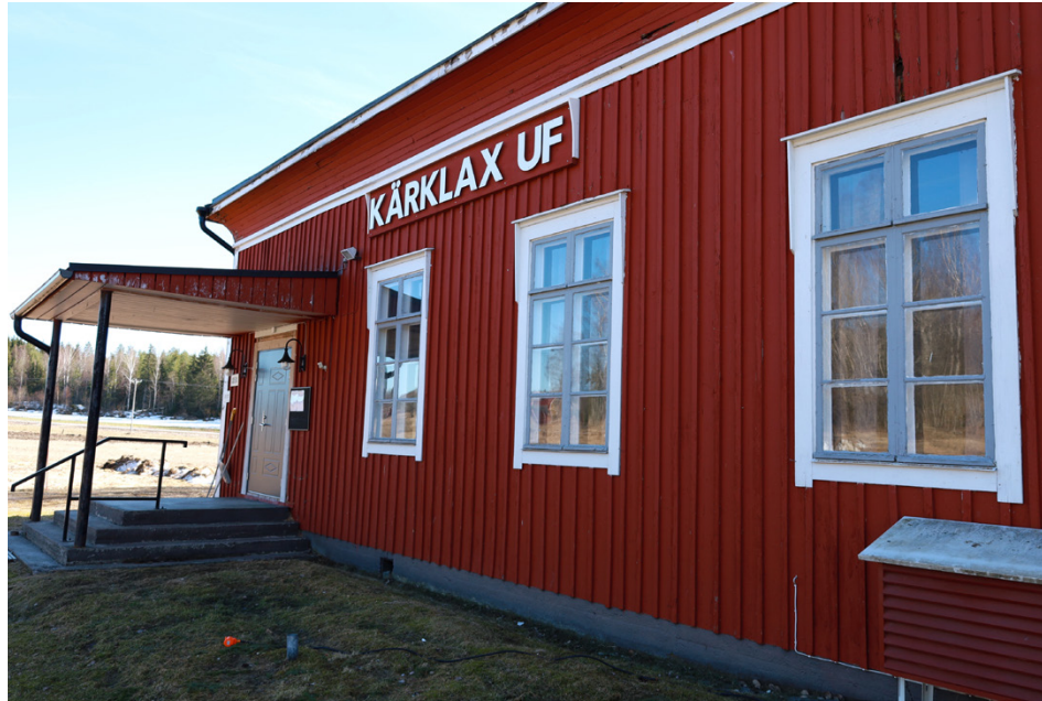
Kärklax ungdomsförening hoppas kunna inleda fönsterrenoveringen så fort vädret tillåter.

–Skorstenarna håller på att komma ner, så det måste åtgärdas ganska omgående. Vi har också planer på att reno-