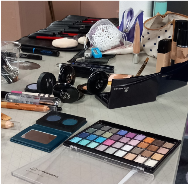
Tyttöryhmän meikkausilta.

– Syynä saattaa olla, että reissut järjestetään huonona ajankohtana. Silloin on lo-