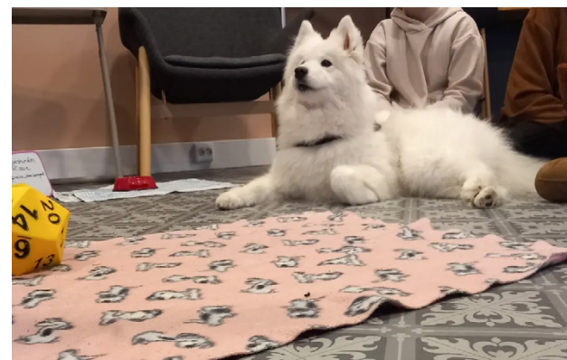
Tjejgruppen hade besök av terapihunden Rosie.