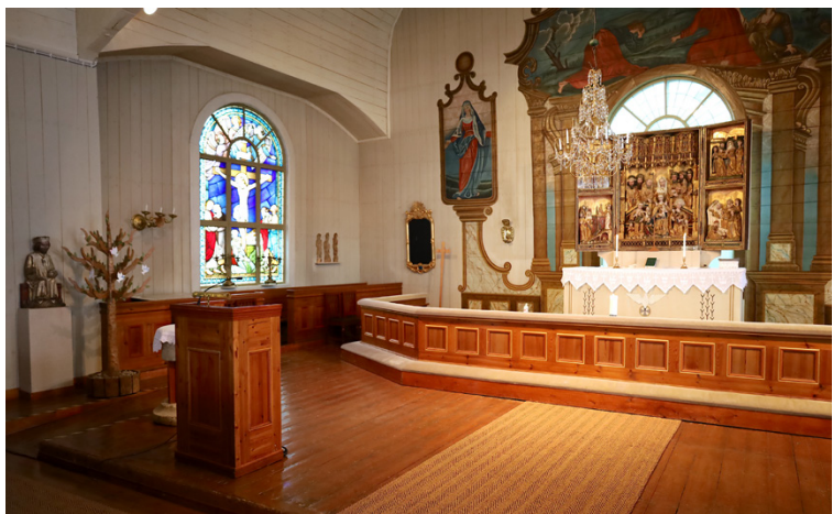
Också framme vid altaret ska trösklarna tas bort. Förslaget från arkitektbyrån är också att låta altarskranket smalna av något, för att ge mera utrymme för till exempel dopceremonier.