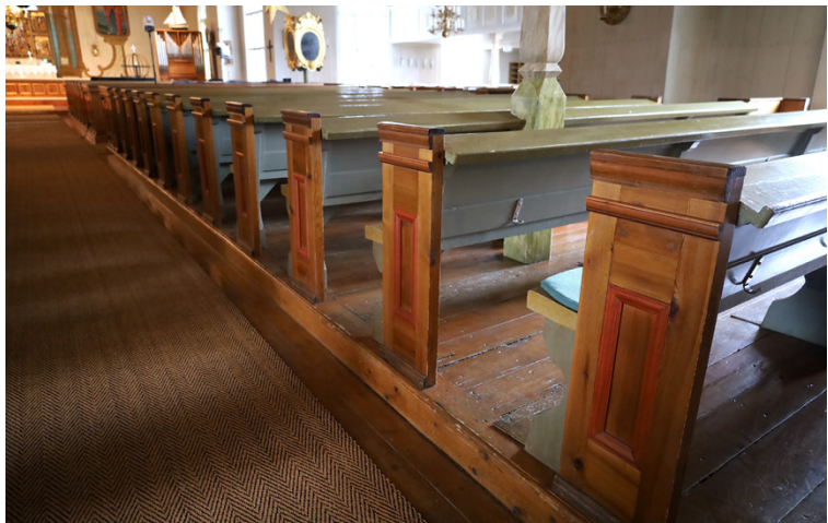
Kyrkbänkarna kommer att finnas kvar på samma platser även efter renoveringen, men upphöjningen ska tas bort för att förbättra tillgängligheten i kyrkan.