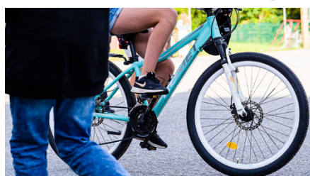
Delta i vår cykelkampanj och vinn en 3-växlad cykel!

- 150 km om du har gått i åk 1-3 under vårterminen 2024 - 250 km om du har gått i åk